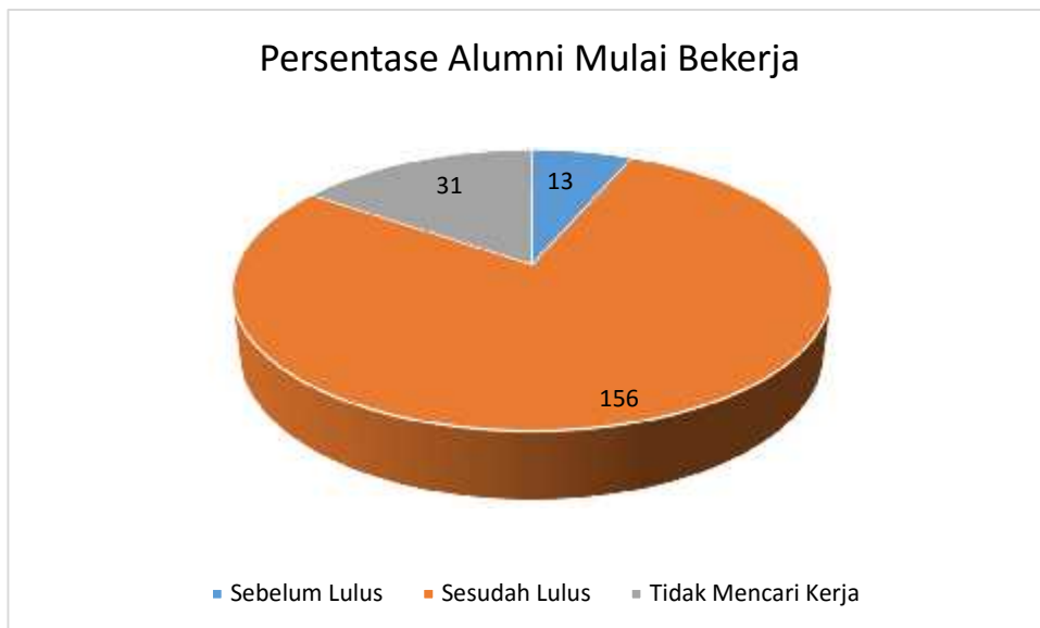
Gambar1: Transisi Mulai Bekerja

Alumni yang memperoleh pekerjaan terbagi menjadi : (1) Alumni bekerja sebelum lulus kuliah, yakni 8%, (2) Alumni bekerja setelah lulus kuliah (92%) dan (3) Alumni bekerja tetapi tidak perlu mencari pekerjaan (18%).